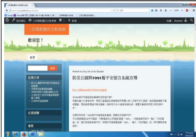
說明：運用本校校園防災教育網進行 1991 報平安專線使用方式與開放時機宣導