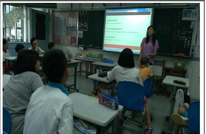
說明：於班級集會進行 1991 報平安專線使用方式與開放時機宣導