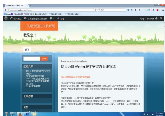
說明：運用本校校園防災教育網進行 1991 報平安專線使用方式與開放時機宣導