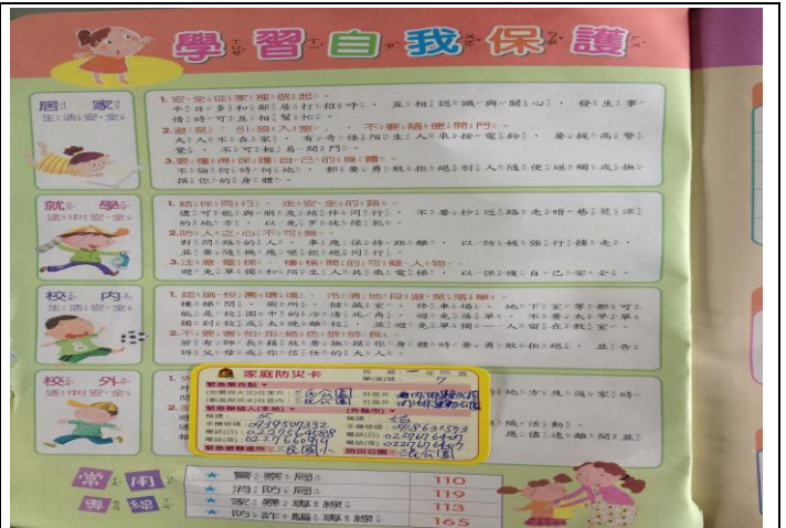
說明：家庭防災卡貼於學生聯絡簿上