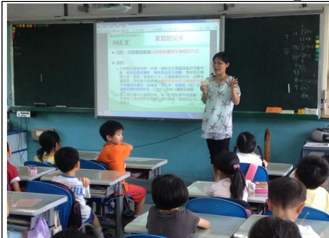
說明：於班級集會說明家庭防災卡目的與填寫方式