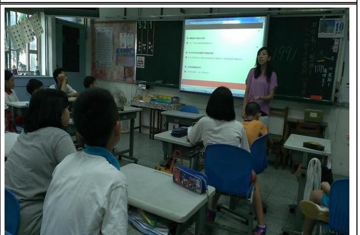
說明：於班級集會進行 1991 報平安專線使用方式與開放時機宣導