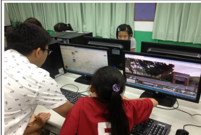
說明：於資訊課程進行各行政區防災公園位置查詢。