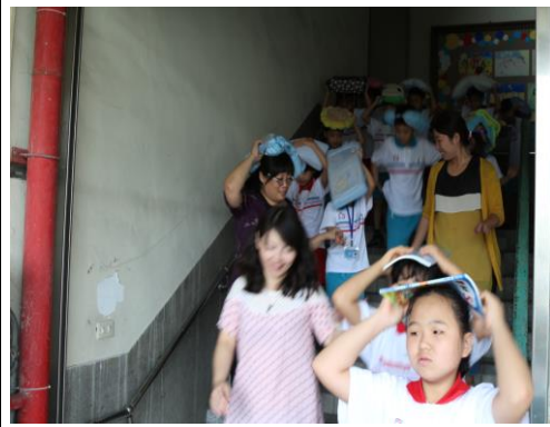
教師帶領學生儘速疏散