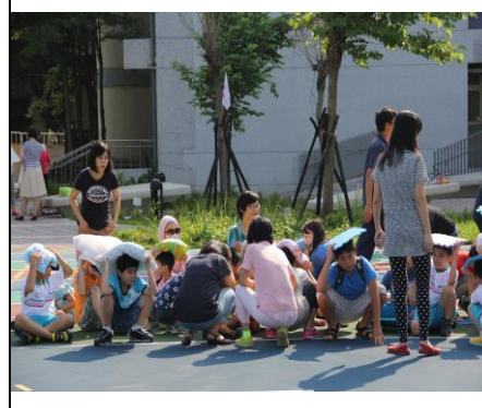
到集合地坐下掩護