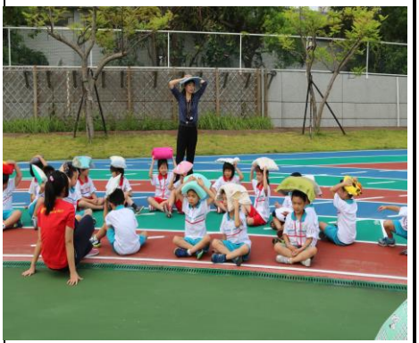
到集合地坐下掩護