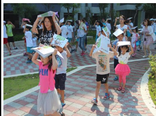
教師帶領學生儘速疏散