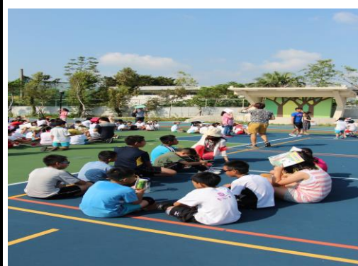
到集合地坐下掩護