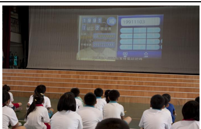
說明：於兒童朝會進行宣導。