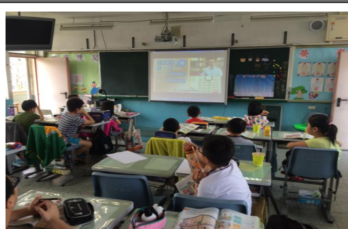
說明：說明：於班級集會進行 1991 報平安專線使用方式與開放時機宣導