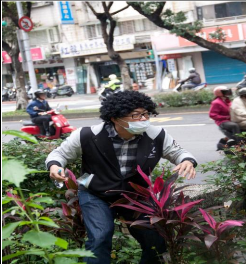
可疑人士翻牆進入校園