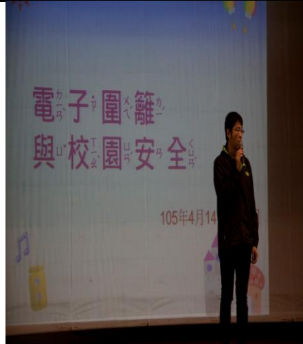
於兒童朝會進行電子圍籬與校園安全演練宣導