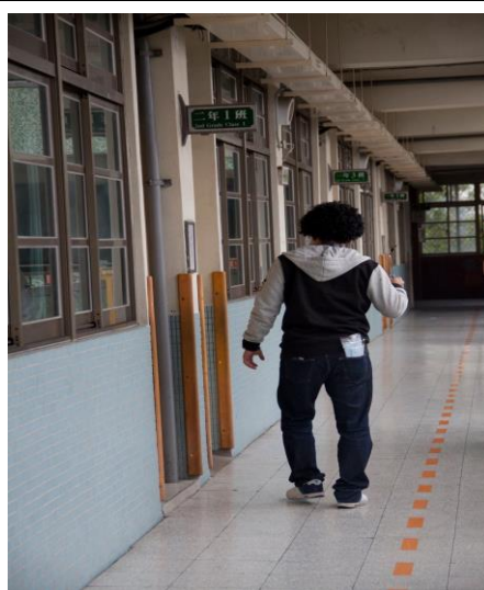
各班教室門窗緊閉