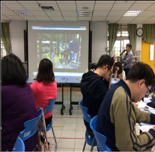
於教師晨會進行校安演練宣導