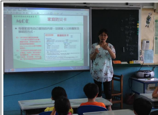
說明： 於班級集會說明家庭防災卡目的與填寫方式