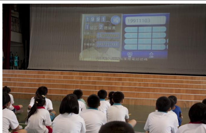
說明：於兒童朝會進行宣導。