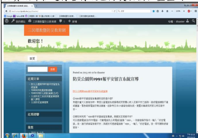
說明：運用本校校園防災教育網進行 1991 報平安專線使用方式與開放時機宣導