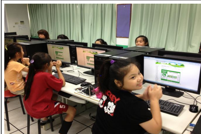
說明： 於資訊課程進行各行政區防災公園位置查詢