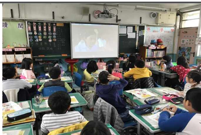
說明：說明：於班級集會進行 1991 報平安專線使用方式與開放時機宣導