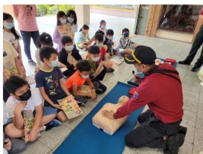
認識 CPR 及 AED