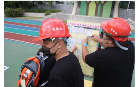
通報組報報人員失蹤