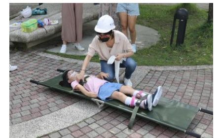
救護組進行緊急治療