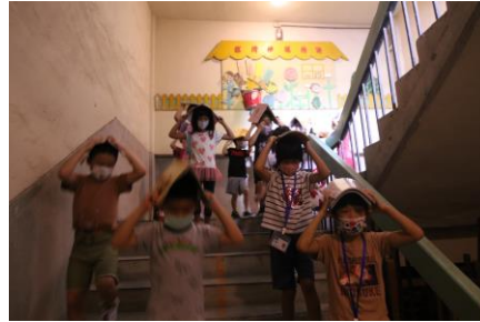
第一階段防空疏散動作