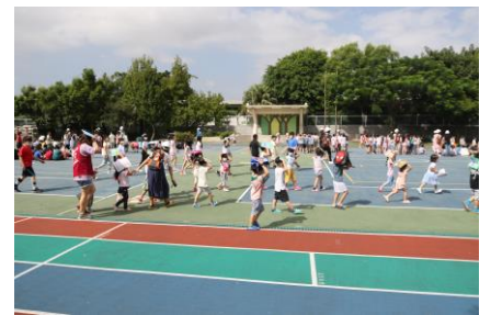
防震疏散至戶外操場