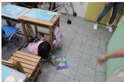
搶救組進行人員搜尋