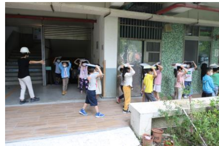
第二階段防震疏散動作