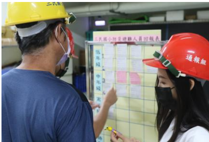
指揮中心進行人員清查