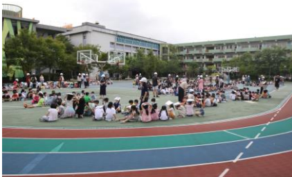
各班級進行人數清點