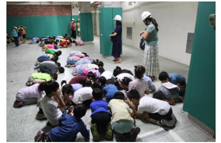
防空避難掩避動作