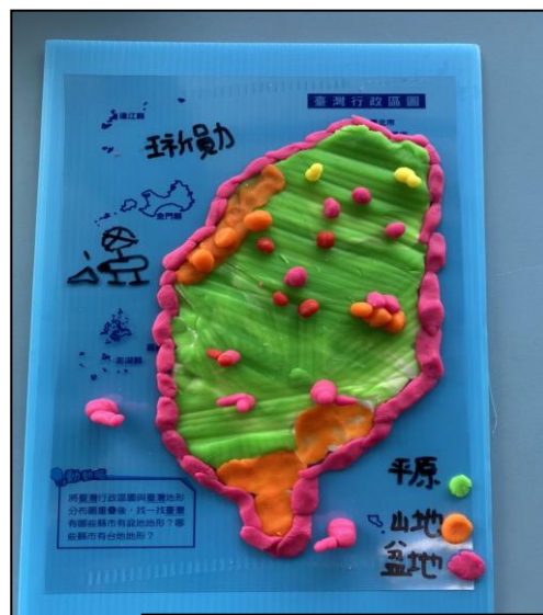
臺灣地理位置模型